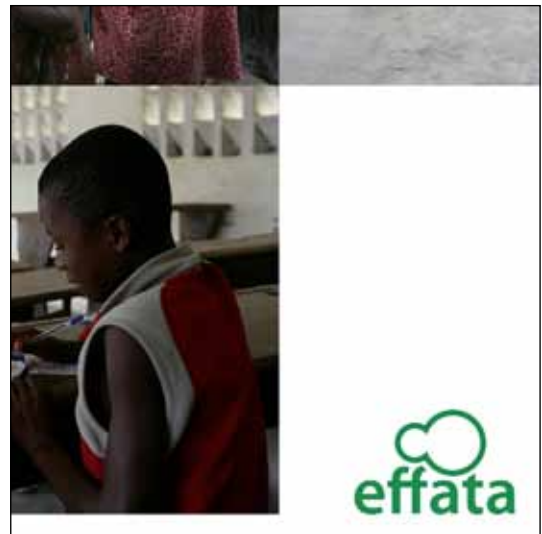
projet EFFATA / 7 - b