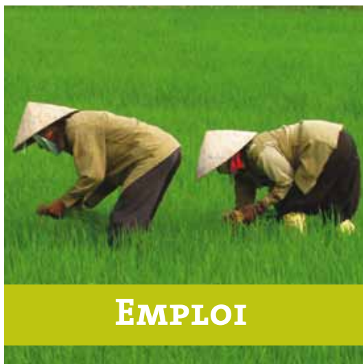
projet MEKONG PLUS / 2 - a