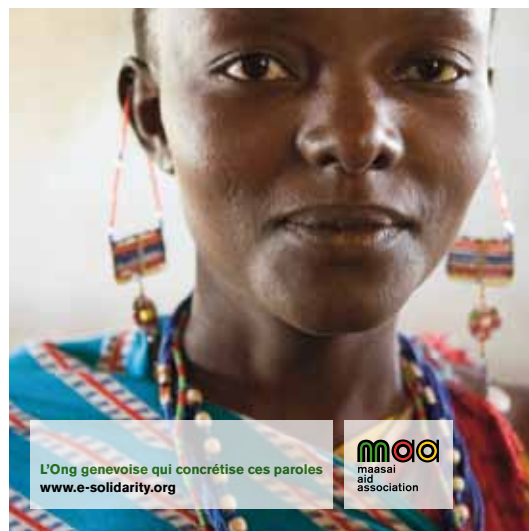
projet MAA / 3 - a