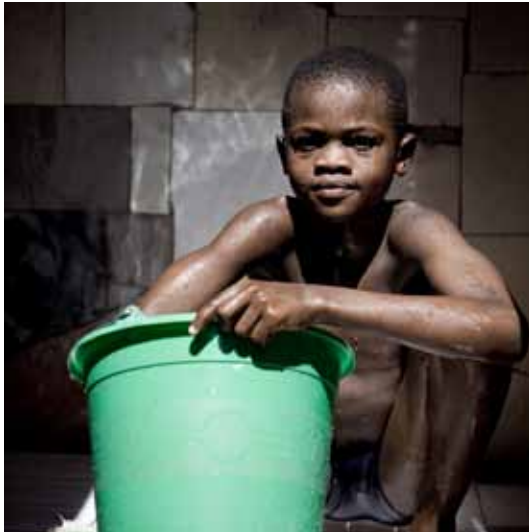
projet ADCO / 9 - a