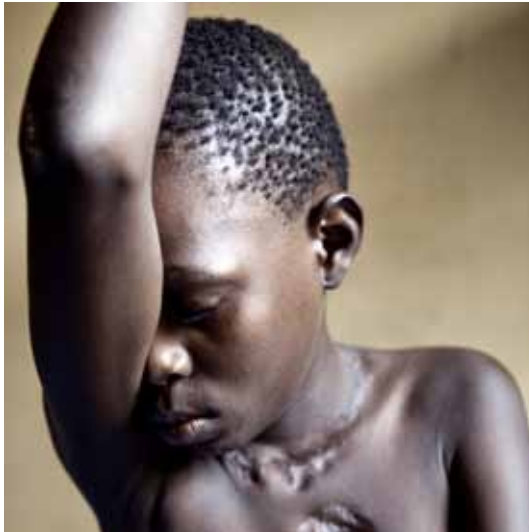
projet ADCO / 9 - a