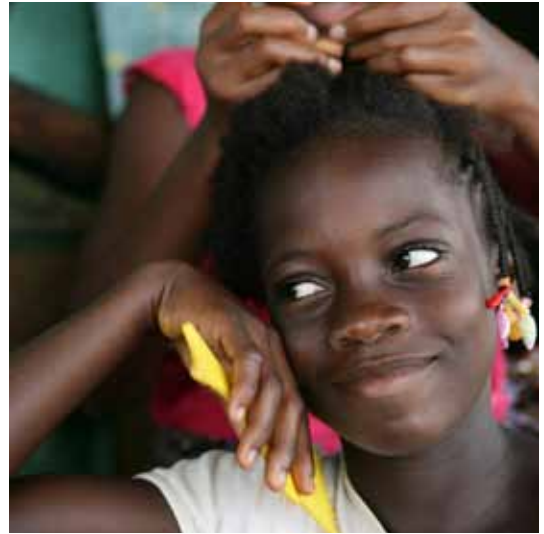
projet EFFATA / 7 - a