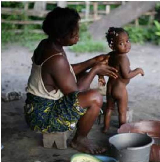
projet EFFATA / 7 - a