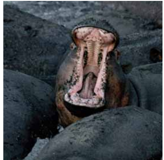
projet ADAP / 11 - a