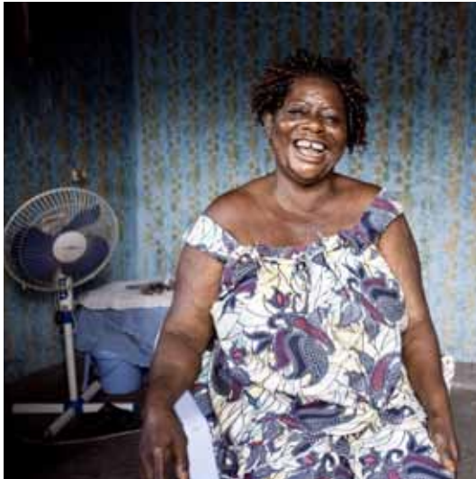
projet ADCO / 9 - a

Au fil des années la Fondation acquière une certaine expérience et ses objectifs sont de plus en plus clairs.