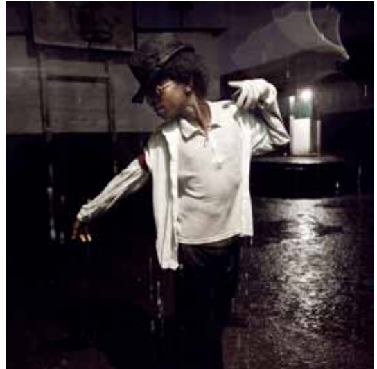
projet ADCO / 9 - a