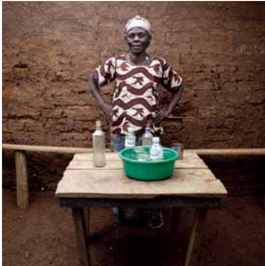
projet KAF / 8 - a