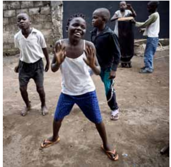
projet ADCO / 9 - a