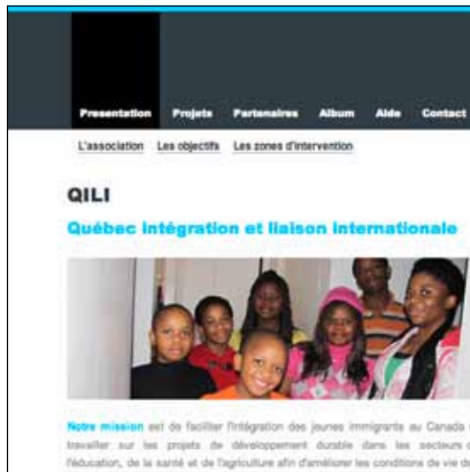
projet QILI / 4 - a