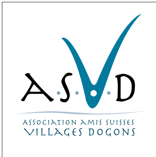
projet ASVD / 13 - a