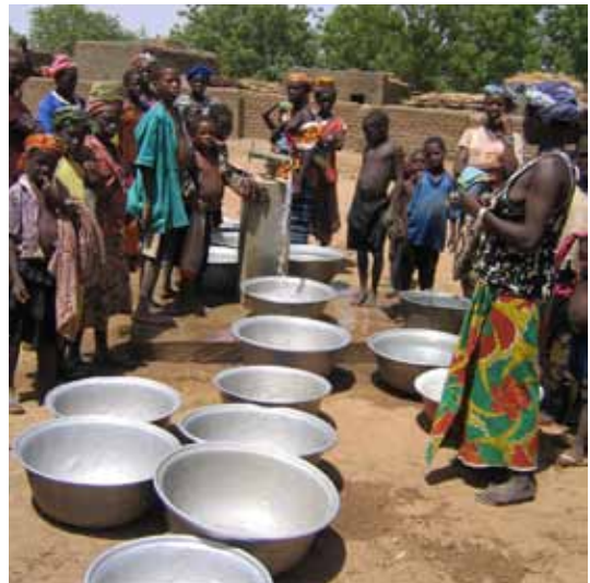
projet ASVD / 13 - a