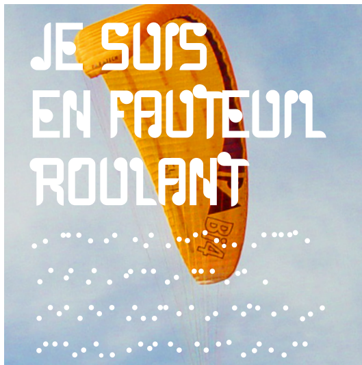
projet CFRGE / 6 - b