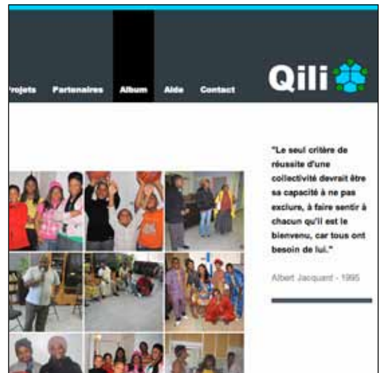
projet QILI / 4 - a

Entamées en fin d'année 2009, des démarches d'engagement d'un stagiaire se sont poursuivies durant le début d'année.