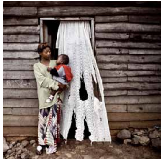
projet KAF / 8 - a