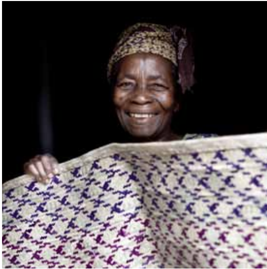
projet KAF / 8 - a