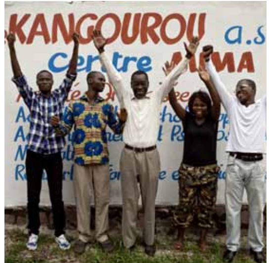
projet ADCO / 9 - a