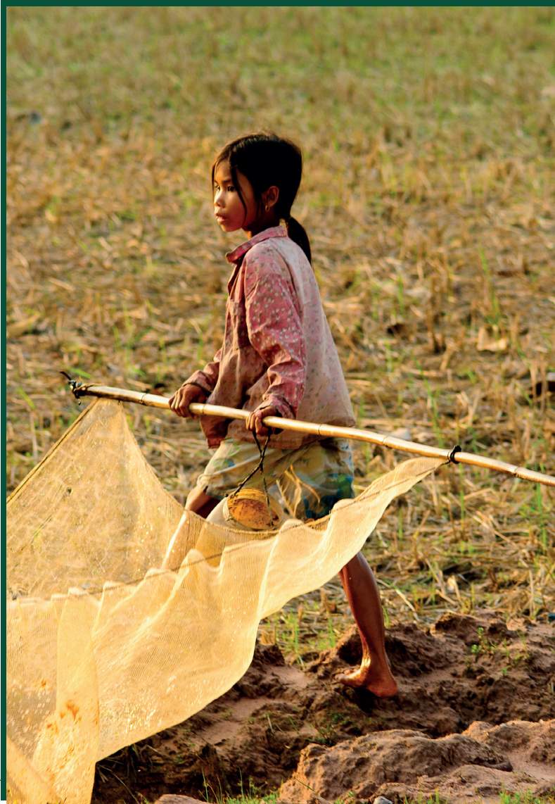
Editeur responsable : Yaël van den Hove