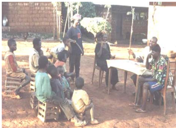
Rencontre avec deux (02) familles dans le cadre d'un projet de solidarité nationale initié par HURIFBA pour la scolarisation de quelques enfants issus des familles nécessiteuses dans la province de l'Ouest Cameroun.

L'éducation primaire pour tous les enfants est aujourd'hui un impératif pour les parents. Elle est le point de départ de tous les défis et nécessite un intérêt particulier. Dans ce contexte, HURIFBA s'est chargée d'apporter cette information à tous les parents dans les villages et fermes les plus reculés.