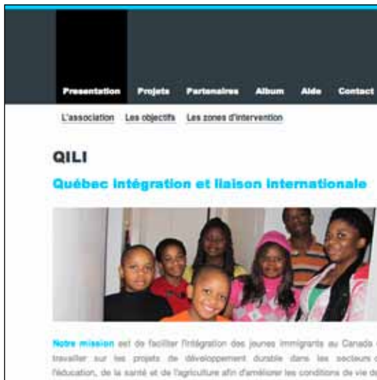
projet QILI / 4 - a