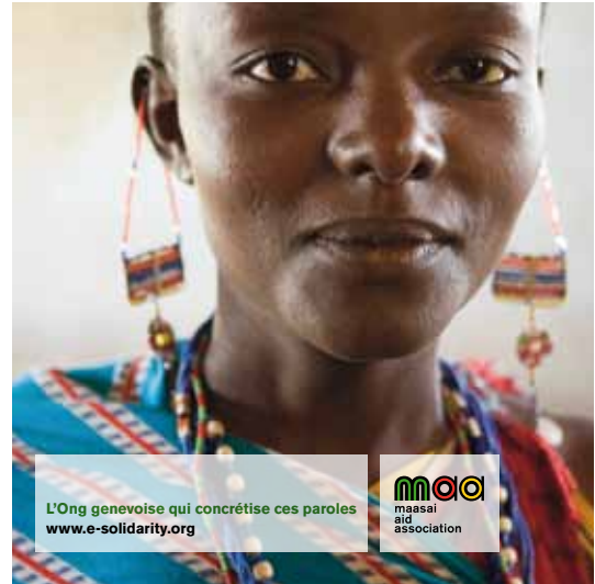
projet MAA / 3 - a