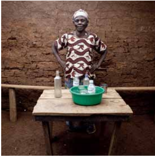
projet KAF / 8 - a